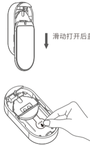
取下电池绝缘片通电